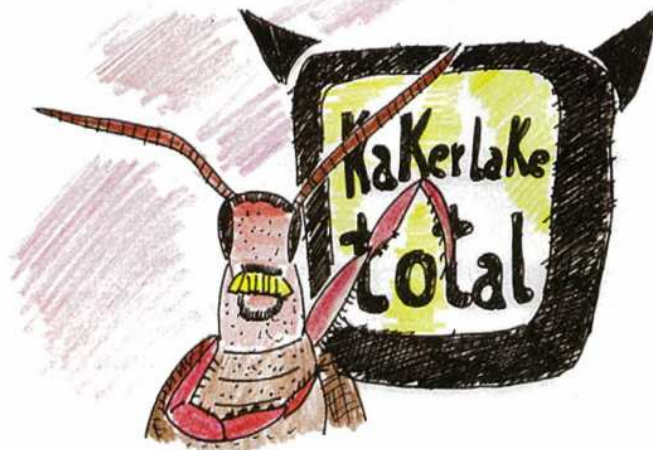
KAKERLAKEN ( BLATTELLA GERMANICA ), die erfolgreiche TV-Konzepte kopieren