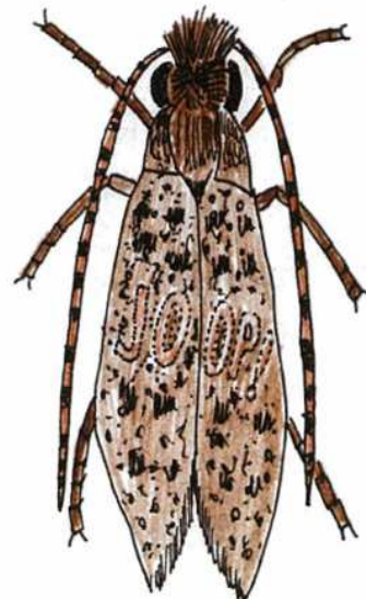
KLEIDERMOTTEN ( TINEOLA BISSELLIALLA ), die bei der Nahrungsaufnahme bestimmte Marken bevorzugen