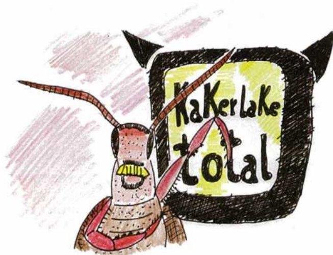
KAKERLAKEN ( BLATTELLA GERMANICA ), die erfolgreiche TV-Konzepte kopieren