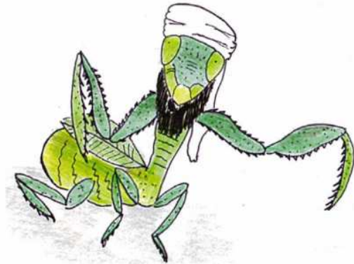
Männchen der GOTTESANBETERIN ( MANTIS RELIGIOSA ), die zum Islam konvertieren